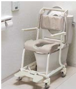
水まわり用車いす