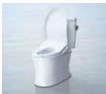
温水洗浄便座 ウォシュレット®