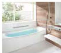
ユニットバスルーム