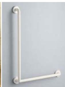
インテリア・バー (手すり)