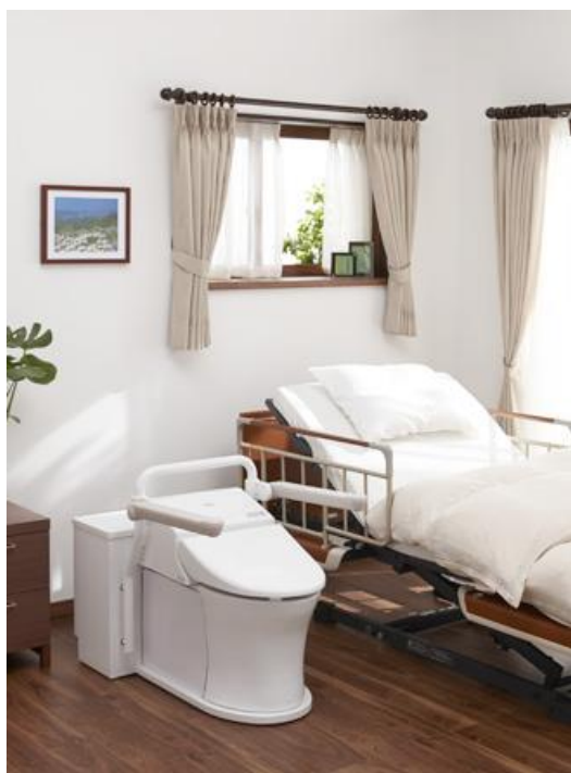
一般家庭居室設置イメージ