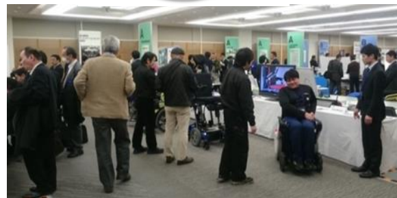
交流会の様子（左：大阪会場 / 右：東京会場）

※交流会の最新情報： http://www.techno-aids.or.jp/ （情報は随時更新します）